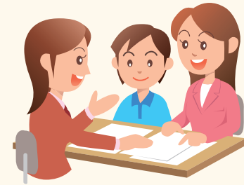
相談専用フォーム