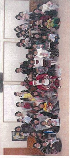
かっこからガールとガールのプレゼントももらったよ!!