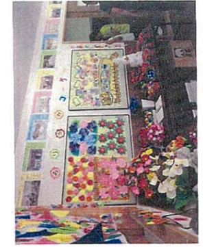
母子室クリスマス会