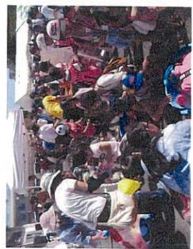
ヨーヨー、くじびき、どんぐりあそびモトのいよ。振りだし物はあったかです。