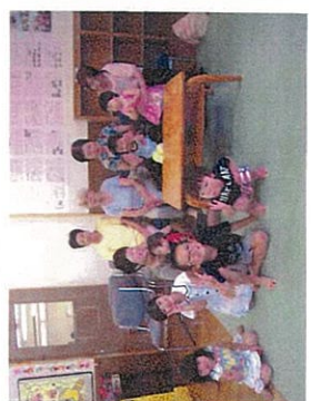
バーバースのみぞさん、食改さん、いつもありがとうございます♡