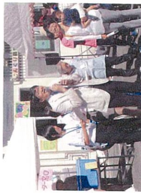
田上市長さん、いつもありがとうございます。