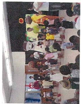
うたっておどろうよのコーナーにアパレルマンが登場。ダンスプログラムには、高校生のお兄さんも参加してくれました。