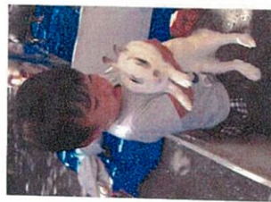
うたぎ、わき、やぎなどのかわいい動物さんがきよよ。