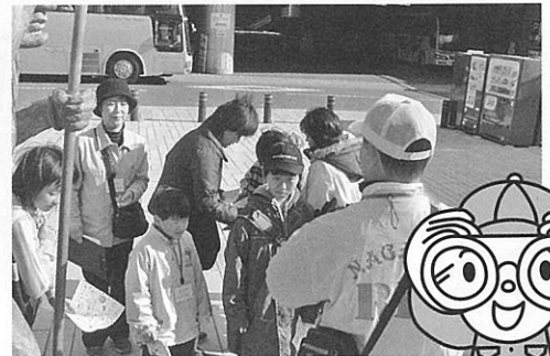
さるくガイドの方の説明に「な～るほど！」

PS：北大浦小育成協は、19 年 3 月 31 日付で学校の統廃合で北大浦小学校が廃止になるため、4 月 1 日より梅香崎中学校区育成協に統合されます。