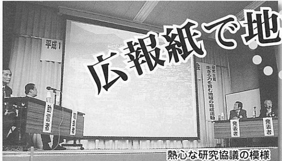
熱心な研究協議の様様