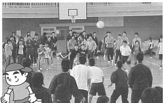
レクリエーションの一コマ

西公民館区では、今後も「クリーン作戦 in 稲佐山」の活動を通じて各校区との親睦及び連携を強めていきたいと考えております。