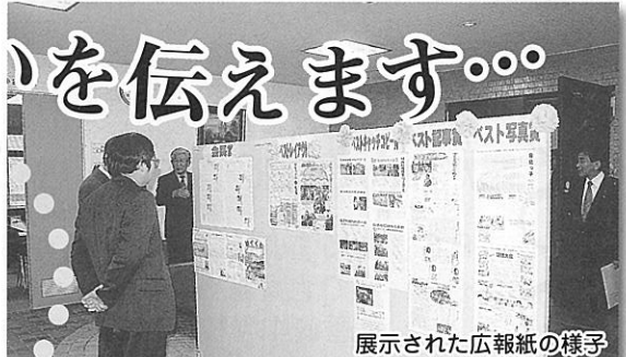
展示された広報紙の様子