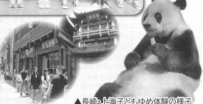
▲長崎・上海子どもゆめ体験の様子