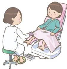
長崎県 年齢階級別罹患数(2019年) 子宮頸がん(女性)